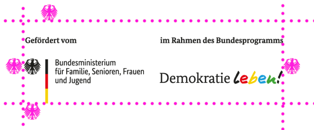
Illustration: Schutzraum um das Logo